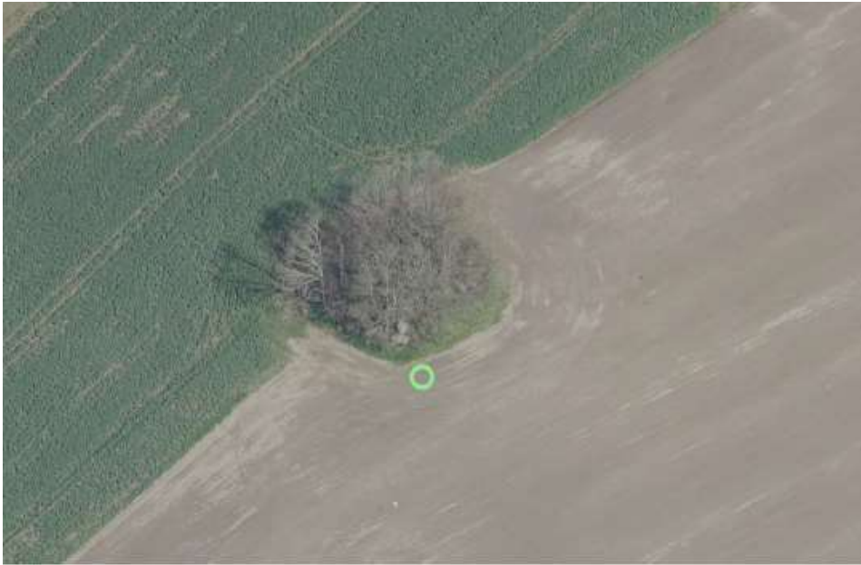
Skråfoto af den lave høj med bevoksning, hvor rose 5135.12 er beliggende