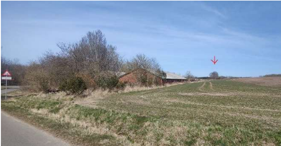
Illustration fra ansøgningen - Kig fra Risenholmsvej mod nord-øst. Pil angiver den bevoksede høj, hvor fortidsminde 5135.12 er beliggende.

Det vurderes derfor, at en dispensation til etablering af solceller, hegn og beplantning som ansøgt indenfor de nuværende beskyttelseslinjer, ikke vil forringe ud- og indsyn til og fra fortidsminderne væsentligt, i forhold til de eksisterende forhold.