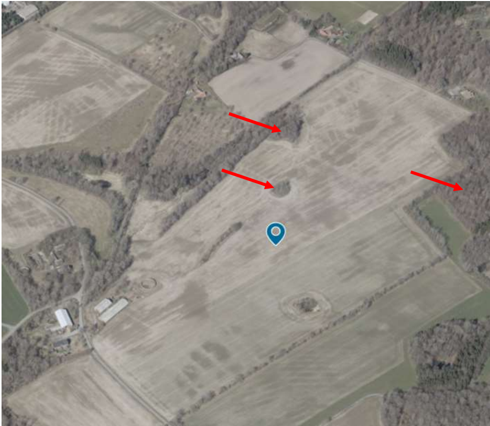
Skråfoto – projektområdet. Fortidsminderne omtrentligt markeret med pile.