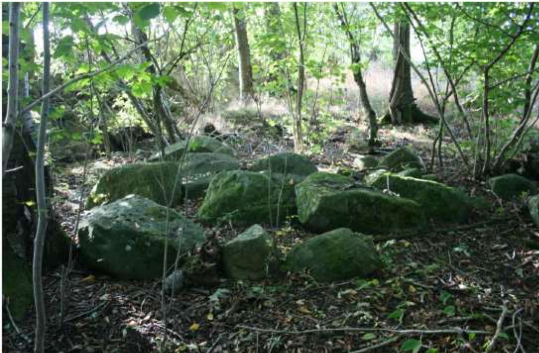
Foto af rose 5135.11 fra Slots- og Kulturstyrelsens registrering.