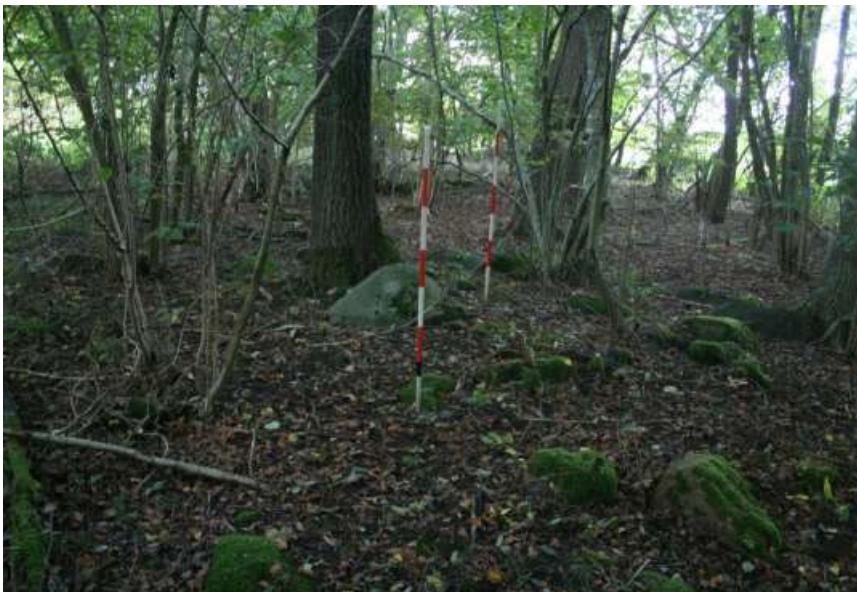
Foto af rose 5135.13 fra Slots- og kulturstyrelsens registrering.

Bevoksning: 1985: Mos, Græs og Løvtræer."